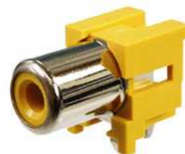
RCA ジャック： RCA2P (x1) (x1)

(※出荷時期により、部品の 外観や規格、定数などは変わ ることがありますのであらかじ めご了承ください)