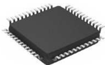
チップ: PCM2706PJTR (x1)