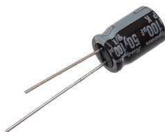
電解コンデンサ： 220uF (x4) 100uF (x1)