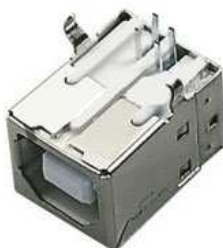
USB コネクタ： UBF-01 (x1)