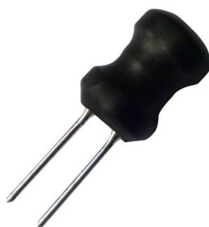
インダクタ： 330uH x1