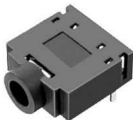
オーディオジャック： PJ-307(x1)